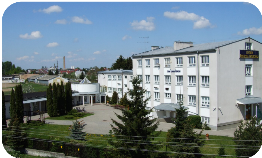
Zespół Szkół Nr 3 w 2004 r.