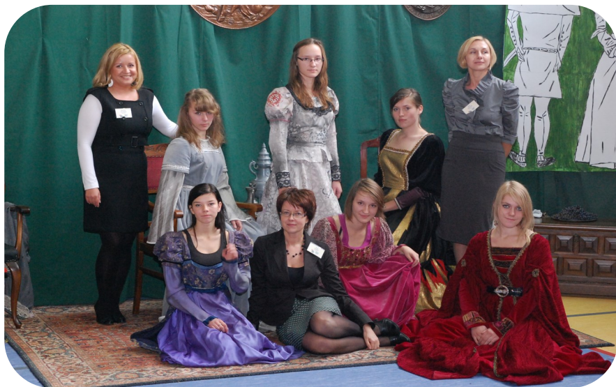
Jarmark renesansowy, otwarcie hali sportowej - 2010 r.