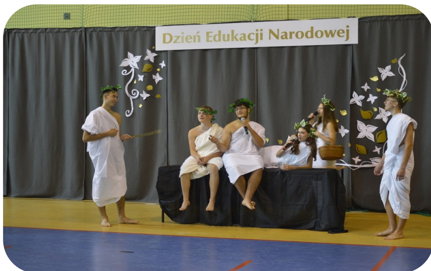
Dzień Edukacji Narodowej - 2023 r.