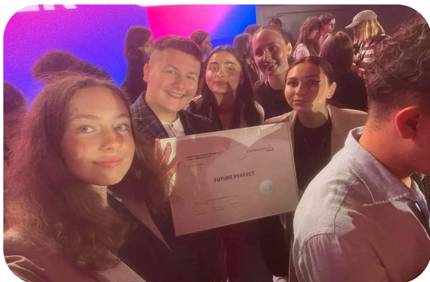
Zwycięzcy ogólnopolskiego projektu Future Perfect - 2024 r.