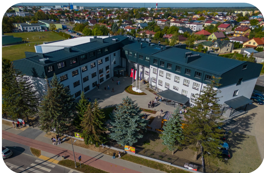
Zespół Szkół Nr 3 w 2024 r.