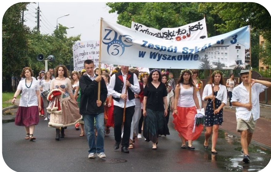
Obchody dnia Patrona - 2017 r.