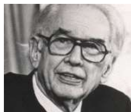
John Vincent Atanasoff