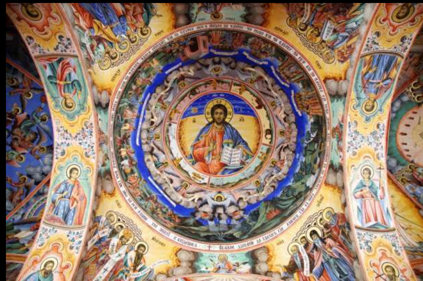
Chrześcijańskie malarstwo - w klasztorze Riła

Kraj posiada bogate tradycje w dziedzinie teatru lalkowego.